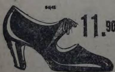
Cabritilla Mayer Gdo. 7.

Hoy "EL LIMITE", Bm.é. Mitre 1129, inicia la entrega de cada par de calzado en un ESTUCHE-VALIJA-COSTURERO, que sólo por ser obra de "EL LIMITE" puede ser realizada sin aumentar el precio del calzado y sin desmejorar la calidad.